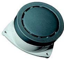
80dB hoorn 100Hz/230Vac