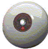
Schoolbel 20cm diameter/230Vac