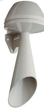
108dB hoorn 100Hz/230Vac